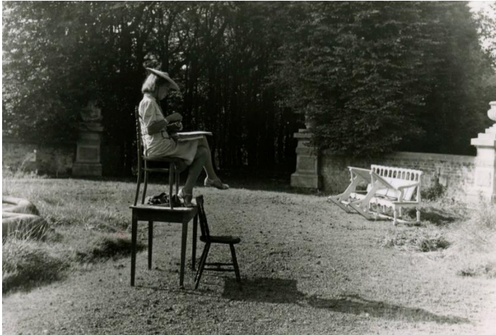
Foto: Sjuwke Kunst tekenend in de tuin van kasteel Eijsden (1942). Foto: Nicolaas Wijnberg