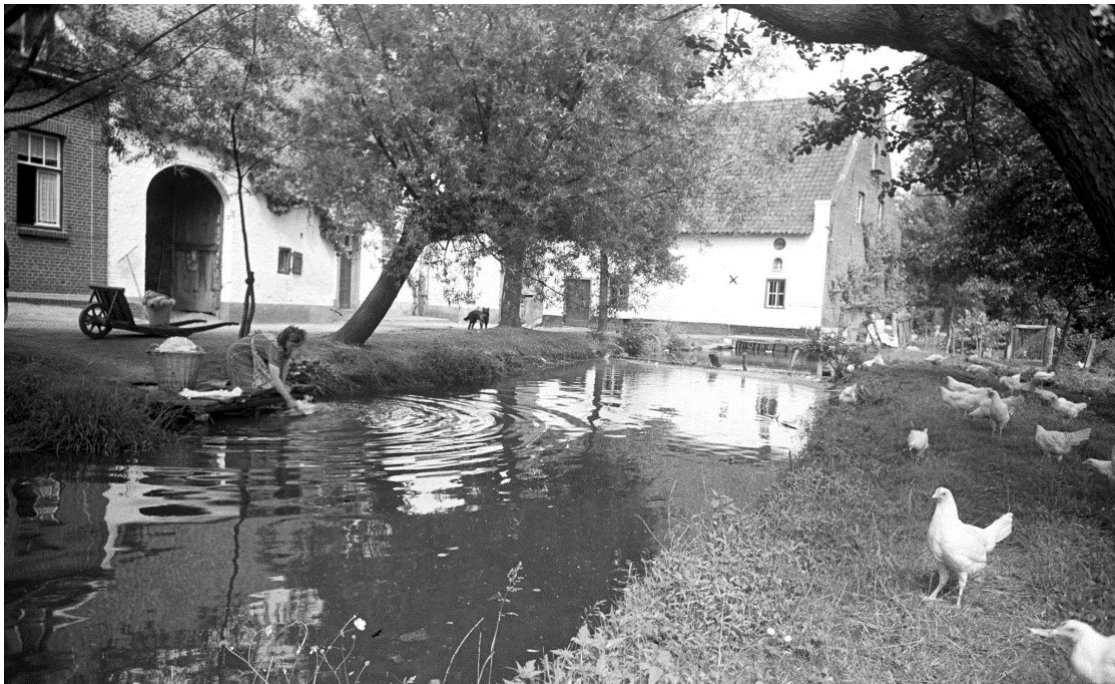
Thorn (1948).